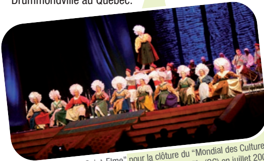
Final du "Branle de Saint-Elme" pour la clôture du "Mondial des Cultures" de Drummondville (QC) en juillet 2008.

La seconde création c'est "1900". Ce thème totalement nouveau et que La Poulido est le premier ensemble de Provence à visiter, illustrera la vie en 1900. Grandes robes longues et corsetées... 1900 nous plonge dans l'univers de Pagnol à la naissance du XX e siècle. Valses, polkas, danse des ombrelles communiquent la douceur de vivre d'un siècle que le tumulte fracassant de l'Histoire aura tôt fait de balayer. C'est l'avènement des premiers ensembles folkloriques, des farandoles et du félibrige de Mistral. Une époque qui sonne comme un âge d'or de la Provence.